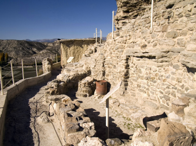
Cadres domestiques sur la Terrasse Intermédiaire