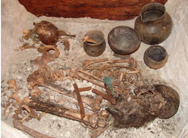
Restes de la sépulture 121

Il s'agissait d'une sépulture en caveau, habituellement utilisée dans le site, et la fermeture a été faite avec de grosses planches en pin noir sur lesquelles était étalée une couche de boue et un mur en maçonnerie a été préalablement posé. Cette fermeture hermétique a isolé pendant des siècles la sépulture, et n'a laissé filtrer ni terre ni eau, ce qui, associé à la grande sécheresse environnementale a favorisé la momification par déshydratation.