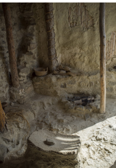
Intérieur d'un logement reconstruit

Le paysage qui nous entoure a beaucoup changé durant les 40 siècles derniers, car le climat actuel est plus sec. Les études réalisées à Castellón Alto indiquent un paysage de forêt méditerranéenne qui laisse apparaître les premiers symptômes de dégradation causée par l'homme.