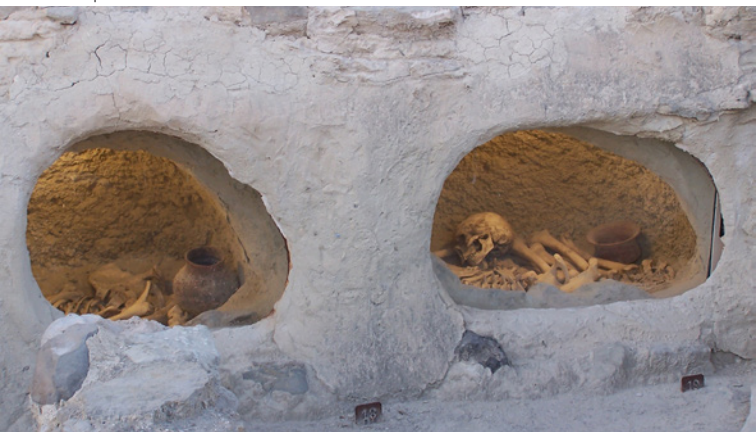
Sépultures 18 et 19 du versant

La paléanthropologie, science qui étudie les restes osseux humains, génère une importante information à Castellón Alto. L'espérance de vie moyenne était de 23 ans, car le taux de mortalité infantile était élevé. Les garçons ont souffert de traumatismes sur les épaules et la colonne, dus aux dures activités comme le transport de poids. Les femmes étaient atteintes aux coudes et dans la zone lombaire à cause du moulage des céréales. Les restes trouvés nous offrent également des informations relatives aux différences alimentaires entre les individus de la même colonie.